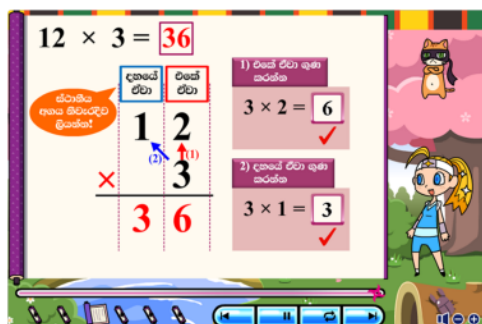
掛け算 (シンハラ語)

今回の導入を機に、さらにスリランカ国内での導入を広めるとともに、この実績を活かしてインドネシアやフィリピンでも現地の教育機関や NGO、NPO などと組むことで、一層の事業拡大を目指していきます。