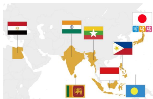
「Surala Ninja!」は7か国の子どもたちに利用されています